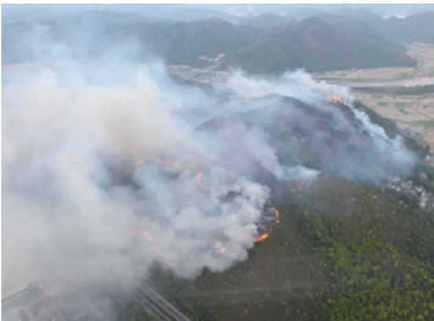
兵庫県赤穂市の林野火災（平成26年5月） この火災の影響により高速道路が通行止めとなった