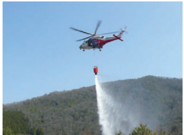
空中消火を実施する広島県防災ヘリコプター